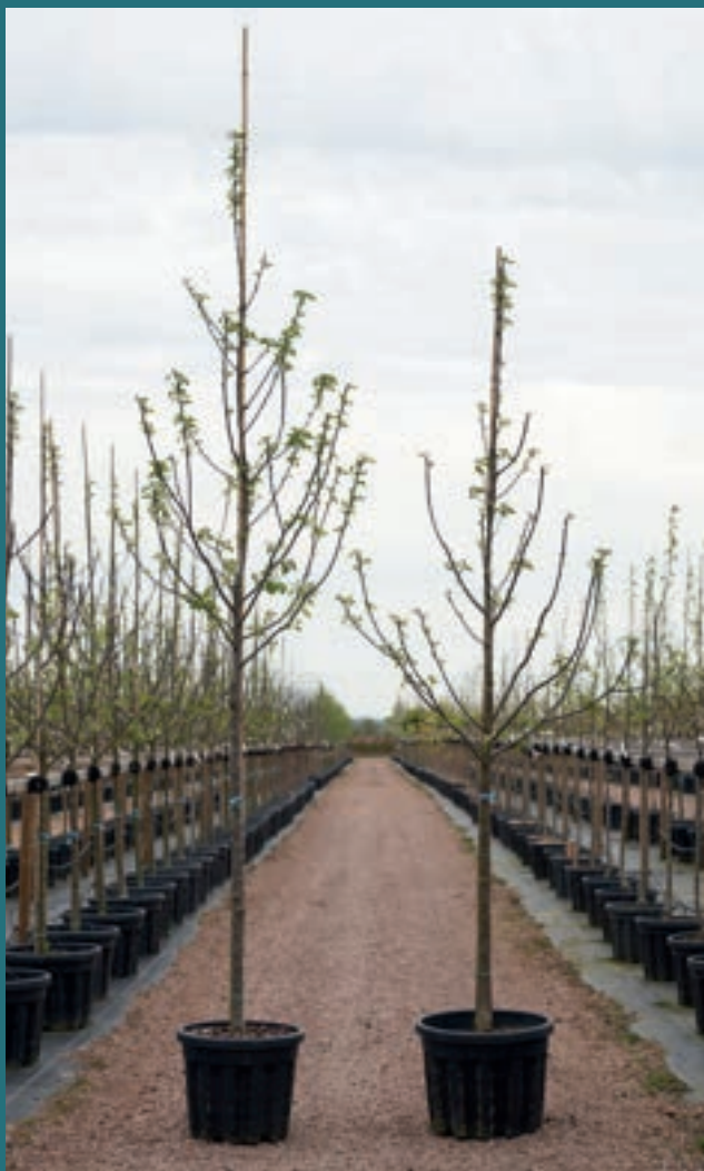
På bilden ser ni kvaliteten Högstam (Hst) till vänster och Halvstam (halvstam) till höger. Båda träden håller storlek 14-16.