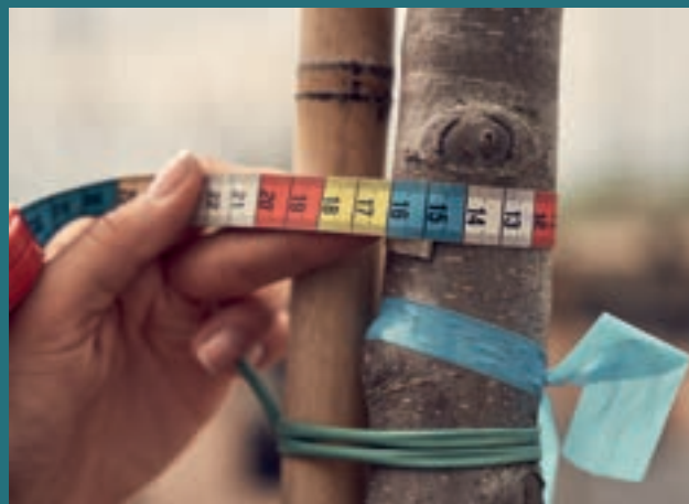
När man benämner storlek på ett fruktträd gör man det genom att ange stamomkretsen mitt på stammen, mellan rothals och krona. I plantskolan har vi specialtillverkade måttband som även är färgkodade, då varje trädstorlek har en färgkod.