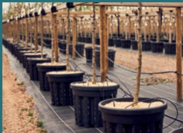
Både våra Premium fruktträd (Hst och halvstam) och fleråriga fruktträd i mindre storlekar odlas i en specialkruka sk RCC (Root Control Container).